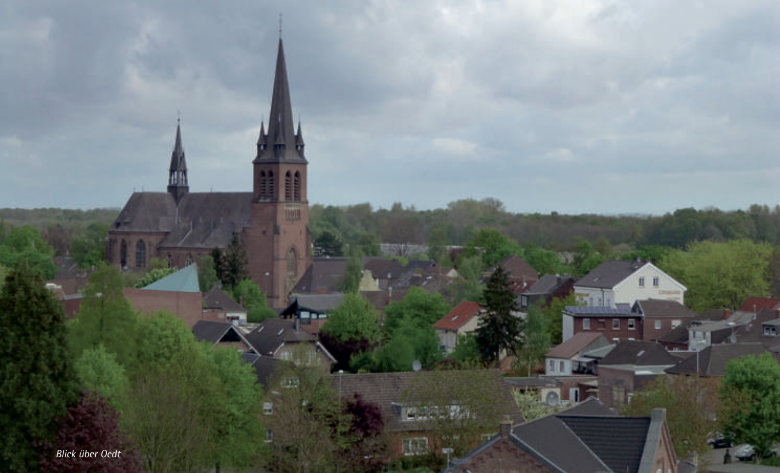
Blick über Oedt

graben zu untersuchen, bevor wieder Ruhe in die Burgruine einzog, und sie in eine Art Dornröschenschlaf versank.